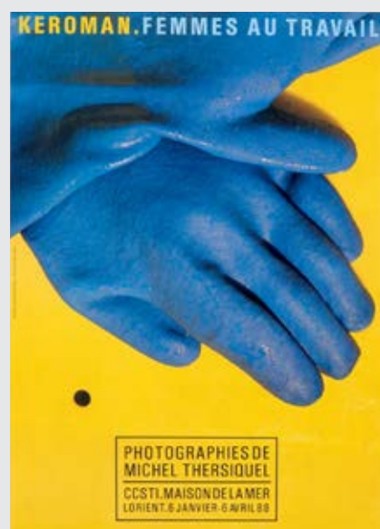
Affiche : Alain Le Quernec, 1988.